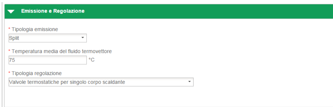
Figura 124 - 2.C Solare termico - Emissione

In questa sezione l'utente deve dichiarare la tipologia di emissione.